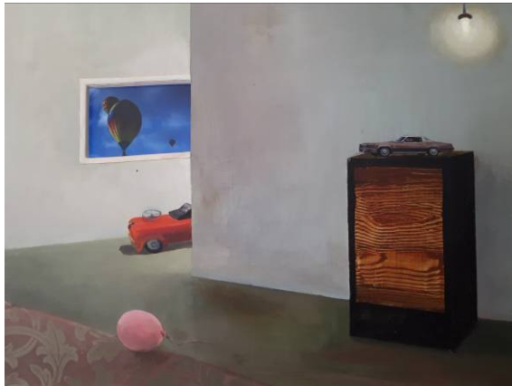
Schilderij: Marjan Jaspers

Deze coronatijd is een tijd van stilstand maar óók een van beweging. Zoals ook op het schilderij van Marjan Jaspers te zien is. De ballon en de auto liggen er stil bij maar in de verte bij het raam bewegen de ballonnen.